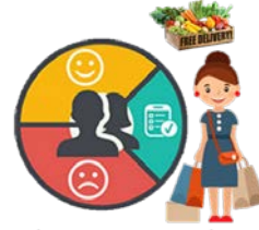
ข้อมูลของลูกค้า Customer Profile